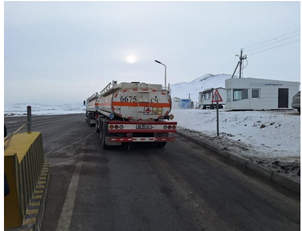
“Түргэний гүүр” төлбөр авах цэгийн хяналт шалгалт

Улсын чанартай Улаанбаатар-Мандалговь чиглэлийн А0201 дугаартай авто замд байршилтай “Түргэний гүүр” төлбөр авах цэгийн төлбөрийг цахим хэлбэрээр авч байгаа бөгөөд 2019 онд ашиглалтад орсон ХК3190-М1 загварын автомашины динамик пүүг ашиглаж байна. Стандартчилал, хэмжил зүйн газраас “Зам, тээврийн хөгжлийн төв” ТӨҮГ-д ашиглаж буй дээрх жинг баталгаажуулан 2025 оны 04 дүгээр сарын 04-ний өдрийн 0003403 дугаартай гэрчилгээг нэг жилийн хугацаатай олгосон боловч хяналт шалгалт хийх явцад ажиллагаагүй байсан тул тээврийн хэрэгслийн гэрчилгээ, техникийн баримт бичгийн бүрдэл, ачилтын баримт, бодит жингийн судалгааг авч ажилласан.